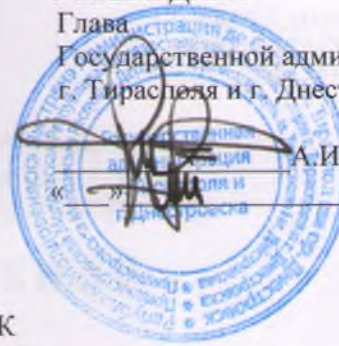
ГРАФИК рабочей недели отдела ЗАГС Государственной администрации г. Тирасполя и г. Днестровска